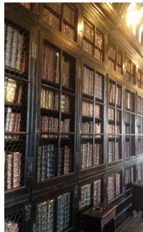
Manchester Chetham's Library

Colore di copertina: Pantone 16-1546 Living Coral, il colore dell'anno